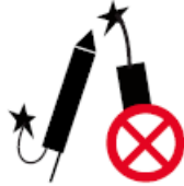
FEUERWERKSKÖRPER, LEUCHTKUGELN, RAUCHPULVER, RAUCHBOMBEN (pyrotechnische Gegenstände)