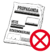
RASSISTISCHES, FREMDEN-FEINDLICHES, EXTREMISTISCHES ODER POLITISCHES PROPAGANDAMATERIAL