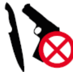
WAFFEN VERSCHIEDENER ART

ES GELTEN DIE HAUS- UND STADIONVERORDNUNG DES SC FREIBURG UND DIE POLIZEIVERORDNUNG DER STADT FREIBURG IM BREISGAU.