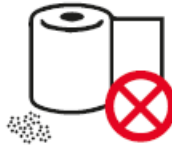
PAPIERROLLEN UND KONFETTI