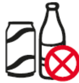
GLASBEHÄLTER, ALKOHOLISCHE GETRÄNKE, FLASCHEN, DOSEN