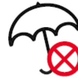
STOCKSCHIRME MIT HOLZ- ODER METALLSPITZE