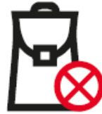
TASCHEN UND RUCKSÄCKE (größer als ein DIN A3 Format)